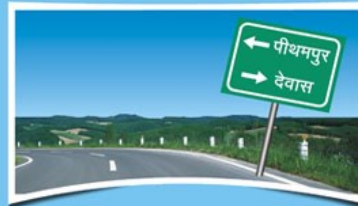
देवास व पीथमपुर औद्योगिक क्षेत्रों से बायपास द्वारा सीधा संपर्क