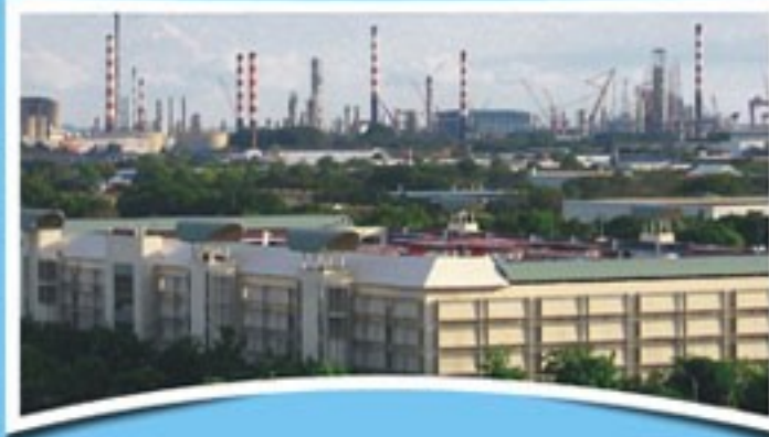
औद्योगिक इकाईयों के लिये निर्धारित परिक्षेत्र