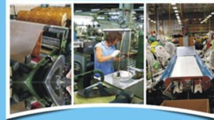
सभी प्रकार के उद्योगों के लिये आदर्श स्थान