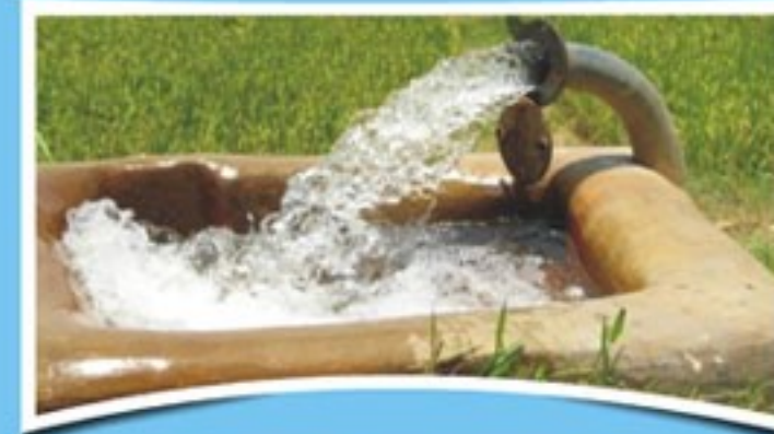
समुचित जल व्यवस्था