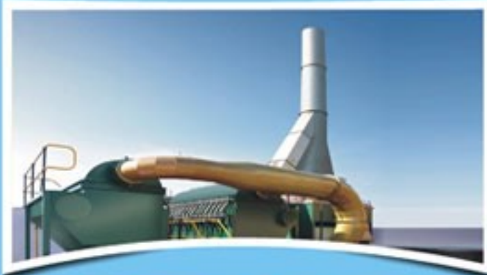
प्रस्तावित आधुनिक औद्योगिक कचरा प्रबंधन