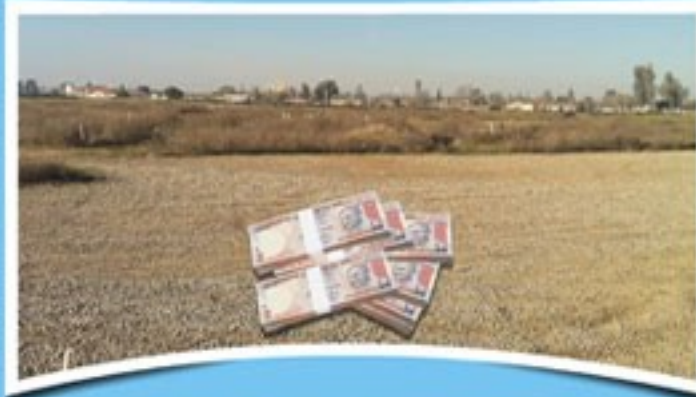
जमीन का ऊंचा मूल्यवर्धन