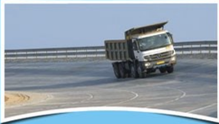
24 घंटे देश के सभी कोनों से भारी परिवहन सुविधा